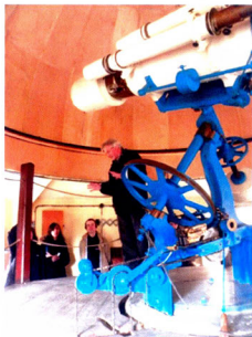
Fot. 7. Niezwykła lekcja historii nauki, ale też historii przemian kulturowych, światopoglądowych, filozoficznych – dzięki temu teleskopowi kształtowała się współczesna astrofizyka.

W ostatnim czasie odwiedziła nas młodzież z Liceum im. Romminiego z Trento (Włochy), realizując program z nauk ścisłych i humanistycznych. Jednym z punktów programu było zapoznanie się ze współczesnymi metodami i narzędziami astrofizyki podczas wizyty w Obserwatorium Astronomicznym UMK w Piwnicach pod Toruniem. Miejsce to sprzyja nowoczesnej edukacji astronomicznej – z jednej strony dzięki niezwyklej historii związanej z astrografem Drapera (fot. 7), z drugiej dzięki będącym na wyposażeniu ośrodka współczesnym instrumentom optycznym (fot. 8) i radiowym (fot. 9).