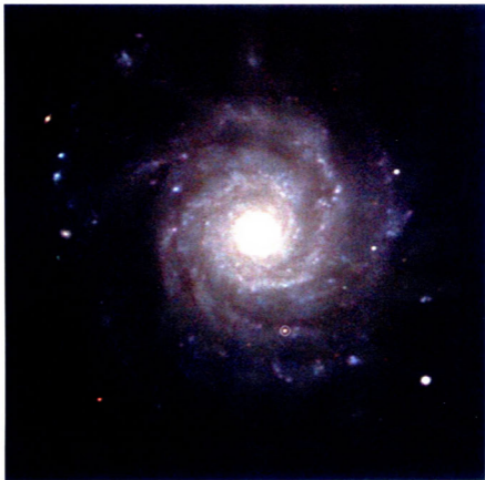
Fot. 3. Zdjęcie galaktyki NGC 3938 z wciąż jeszcze widoczną (ponad 8 miesięcy po wybuchu) supernową 2005ay uzyskane w V LO w Toruniu 1 grudnia 2005 r.

do współpracy pozostałe polskie szkoły. Już po kilku tygodniach widać było pierwsze efekty (fot. 3).