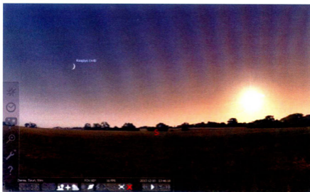
Rys. 1. Zrzut ekranu programu Stellarium – widok dziennego nieba ze Słońcem i Księżycem

„Cóż piękniejszego nad niebo, które przecież ogarnia wszystko, co piękne” – pisał Mikołaj Kopernik w przedmowie do swego dzieła O obrotach . W dzisiejszym świecie, zwłaszcza w miastach, trudno znaleźć miejsce oferujące ten zapierający dech w piersiach widok. Nie zawsze też mamy możliwość szybkiego zorganizowania wyprawy do planetarium. Tymczasem nawet w szkolnej pracowni, używając projektora podłączonego do komputera, możemy zaproponować uczniom ciekawą prezentację namiastki prawdziwego nieba oraz zjawisk na nim zachodzących, dzięki wielu programom astronomicznym typu wirtualne planetarium, np. Stellarium ( www.stellarium.org ). Program ten jest bezpłatny, dostępny na dowolny system operacyjny, posiada też piękną grafikę. Po zainstalowaniu i uruchomieniu będziemy oglądać niebo nad wybranym miejscem w danym czasie (rys. 1).