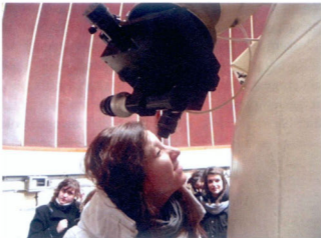
Fot. 8. Nie sposób nie skorzystać z okazji zerknięcia w okular największego w Polsce teleskopu, by przekonać się, że i w dzień na niebie świecą gwiazdy.