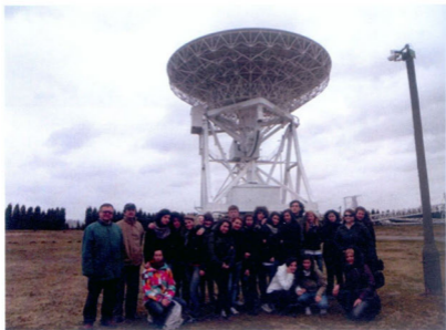
Fot. 9. Pod czasą 32-metrowego radioteleskopu osiągnięcia współczesnej astronomii robią jeszcze większe wrażenie.