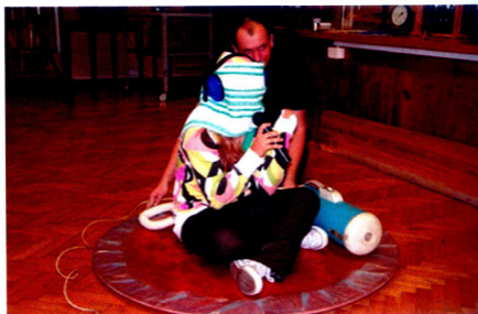
Fot. 4. Model poduszkowca to nie tylko okazja odbicia nietypowej przejażdżki, ale też możliwość zademonstrowania względności ruchu.

obserwowany z obracającego się globusa wygląda dokładnie tak, jak uczy nas codzienne doświadczenie. Dodatkowo odwoływaliśmy się do codziennych doświadczeń potwierdzających względność ruchu (jazda autobusem lub pociągiem), a w celu dodania atrakcyjności tej tezie proponowaliśmy wybranemu uczniowi przejażdżkę na modelu poduszkowca z zawiązanymi oczami i wskazanie po pewnym czasie wybranego kierunku (fot. 4).