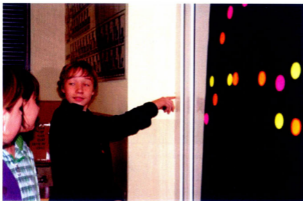
Fot. 5. Uczestnik pokazów w roli nauczyciela – prezentuje koleżankom odnaleziony przez siebie model Ziemi.

Rozrywkowym, choć niezwykle ważnym dydaktycznie elementem była z kolei zabawa z kompasem w odnajdywanie Ziemi jako szpilki z kolorowym łepkiem na orbicie wokół Słońca (fot. 5). Chodziło o zachowanie w miarę wiernej skali rozmiarów i odległości obu ciał. Warunki sali pozwoliły na umieszczenie naszej Ziemi (szpilki) w położeniu odpowiadającym dacie pokazu względem kierunku północ – południe jako osi perihelium – aphelium (przy okazji informowaliśmy uczestników, że Ziemia znajduje się najbliżej Słońca około 3 stycznia).