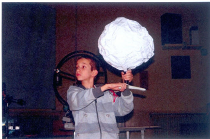
Fot. 6. Księżyc i planety z ogromnym przejęciem wprawiali w ruch uczestnicy pokazów.

jak wygląda ona w zależności od kierunku oświetlenia i dlaczego wbrew pozorom to nie czas pełni jest okresem najdogodniejszym do oglądania struktury powierzchni naszego naturalnego satelity (fot. 6). Podsumowaniem tej części pokazów była demonstracja ruchomego modelu układu Słońce–Ziemia–Księżyc (czyli tellurium), który dodatkowo wykorzystywaliśmy do przypomnienia mechanizmu powstawania zaćmień.