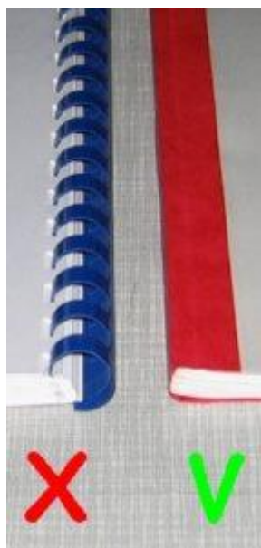
Rysunek 2.1. Nieprawidłowy i prawidłowy sposób bindowania prac dyplomowych przeznaczonych do archiwizacji

Cała praca powinna mieć 35 – 50 stron, włączając w to rysunki i listingi, ale to nie jest ścisły wymóg.